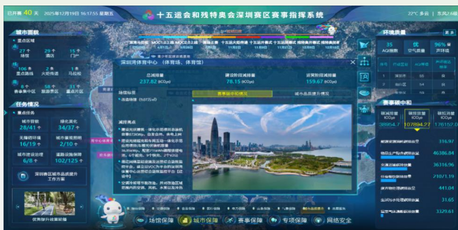
图 8 十五运会和残特奥会深圳赛区赛事指挥系统界面

针对赛事剩余排放，深圳赛区创新采用企业碳资产捐赠与深圳碳普惠减排量协同模式，依法完成碳资产注销，坚决杜绝“名义碳中和”。比亚迪、腾讯等 14 家企业捐赠碳资产 188845tCO 2 e，用于抵消赛事全过程温室气体排放。深圳赛区通过系统减排和规范抵消，成功实现赛事全过程碳中和，为全国大型体育赛事碳中和实践提供了宝贵样本。