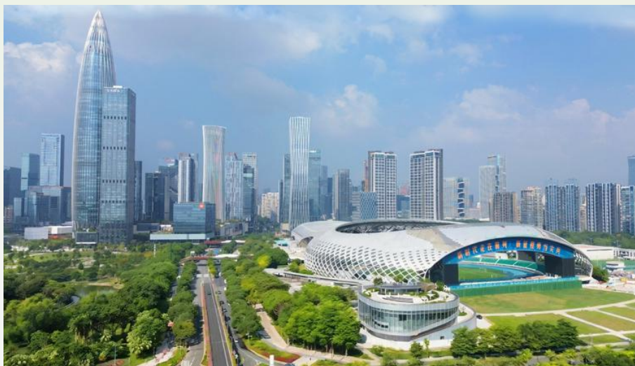
图 1 深圳 110 千伏春晖变电站

同年10月，国内首套应用于变电站实时保供电的构网型风光储一体化系统在该站投运，将风光储与站内用电深度融合，构建主动支撑型智慧微网，具备毫秒级响应、孤岛运行、故障自愈能力，实现市电与清洁能源无缝切换。该系统是构网型储能技术在高负荷密度城市受端电网的重要突破，为新型电力系统安全稳定运行提供了可复制的深圳经验。