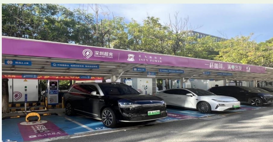
图3 车网互动V2G反向放电实测

基于全市域级的、全自主可控的、精细建模的统一时空信息平台，深圳构建了覆盖全市的充储放一张网平台，建成国内覆盖范围最广、接入分布式种类最多的综合性管理平台，实现分布式资源可观、可测、可控、精准动态调控，不仅为市民提供了“一键找桩、一键充电”的一站式服务，也强化与电动汽车、充换电设施运营商等数据互联互通，助力打造能源安全韧性城市。