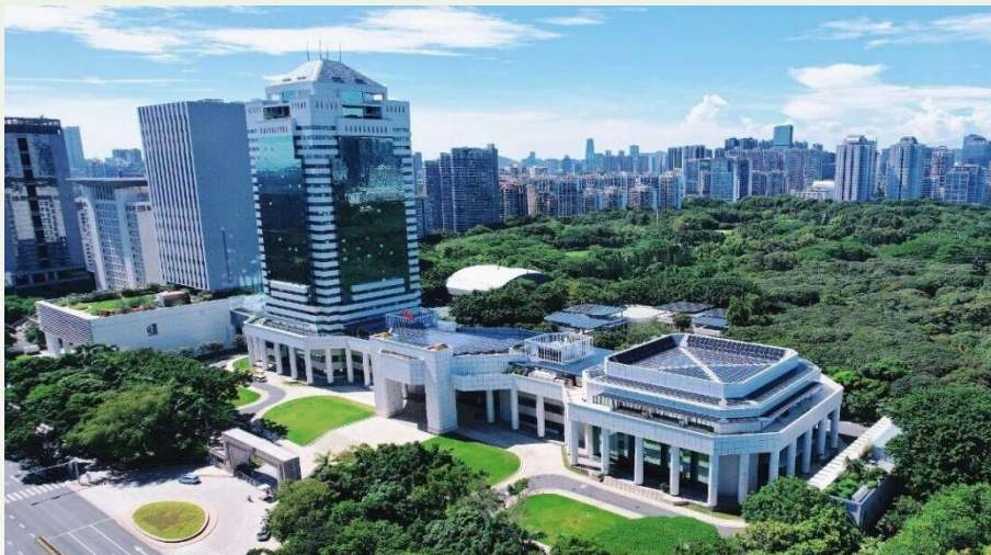
图 6 南山区政府大楼低碳示范改造（一期）项目航拍图

项目创新采用能源费用托管模式，引入“资金方+碳总师”，实现“政府零投入、企业有收益”的可持续路径。项目集成 11 项关键技术、22 类先进产品，成为全国首个且唯一入选“‘十四五’城镇专项科技示范工程——光储直柔示范工程”的机关办公项目、全国首个获三星级光储直柔建筑认证的机关办公项目，树立了公共机构低碳转型的创新典范。