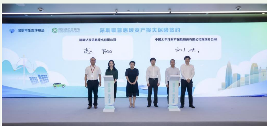
图 5 深圳碳普惠碳资产损失保险签约现场

碳资产损失保险的引入，进一步补齐了碳普惠体系的风险管理环节，形成了“方法学—减排量核证—市场交易—保险保障”的完整闭环。这一创新为碳普惠减排量资产化、金融化提供了可复制的风险对冲工具，有效增强了市场主体参与碳普惠体系的信心和积极性，也为全国碳市场风险管理探索了深圳经验。该产品的落地，是深圳深化碳金融改革、完善碳市场生态的又一标志性成果。