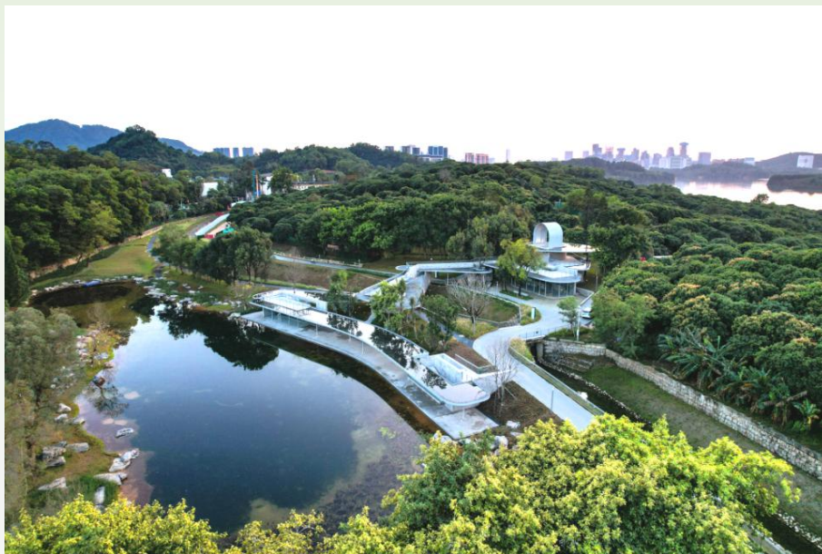
图4 深圳市人才公园二期

人才公园二期为地铁13号线车辆段上盖公园，占地约12.6万 \text{m}^2 ，以“森林海”为理念，通过全域立体绿化实现基础设施与自然生态深度融合，对9万平方米空间实现花园式屋顶绿化。园区配套雨水花园、生态滞留沟及智慧灌溉系统，透水铺装率达85%，构建低碳节水生态系统，以立体增绿、碳汇提升、雨洪调蓄为核心，有效增强城市应对极端气候能力。在大面积立体绿化的作用下，公园碳汇固碳水平显著提升，有力支撑碳中和目标；同时有效缓解城市热岛效应，降低区域温度，改善局部微气候。雨洪管理方面，雨水就地消纳率达91%，大幅增强城市应对极端降雨的韧性；智慧灌溉系统较传统方式节水63%，显著减少水资源消耗及相应碳排放。